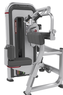
EXTENSIÓN DE TRÍCEPS IPTE3