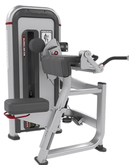
EXTENSIÓN BILATERAL DE BRAZOS IPBA3