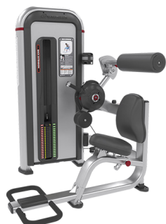
EXTENSIÓN DE ESPALDA IPBE3