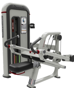
FONDO DE TRÍCEPS IPTD4