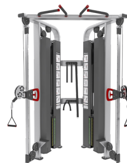
POLEA DOBLE AJUSTABLE 9302NP-D9302