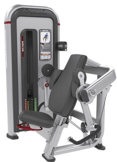
FLEXIÓN DE BÍCEPS IPBC3